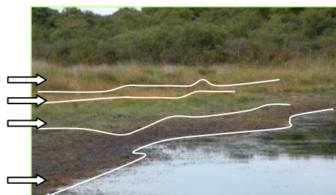
Exemple de ceintures de végétation du système des marais arriere-dunaires

Lande hygrophile à Ericacées Ceinture à Agrostide des chiens Ceinture à Scirpe à nombreuses tiges Végétation amphibie à Jonc bulbeux, Millepertuis des marais et Faux cresson de Thore